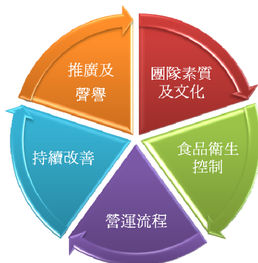
圖二：價值驅動因素

優質服務的背後必定有一些重要的驅動因素支持。參考專家和顧問小組多年來的管理經驗和心得，以「人」、「機」、「物」、「法」和「持續改善」的國際管理概念為框架，總結出下圖的五個價值驅動因素，作為服務管理的主要元素。